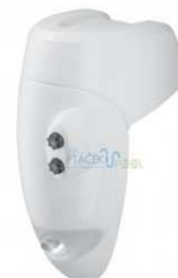
BADU Jet perla