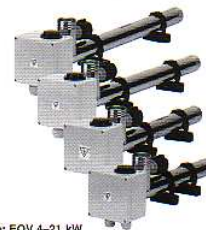
Typ: EOV 4-21 kW

Elektrický ohřev je vybaven termostatem do 40°C a tepelnou pojistkou. Každý el.ohříváč musí být v el.soustavě nainstalován za proudovým chráničem.